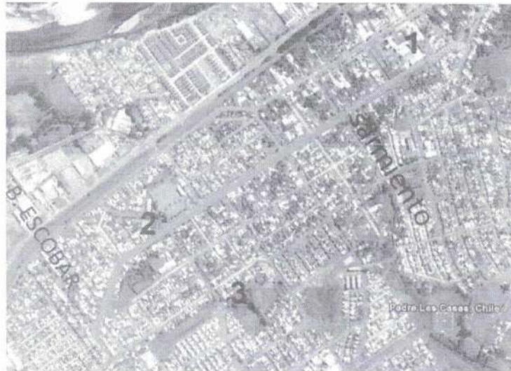
1.Plaza Pleiteado 2. Plaza El Alto 3. Parque Corvalán

El proyecto tiene una extensión aproximada de 965 m/l. La superficie aproximada de intervención asciende a 1.0.490 m 2 corresponde al área entre líneas oficiales del tramo sin contar la calzada (7m.), y contempla la superficie correspondiente a un área verde. La intervención contempla la reestructuración de las actuales aceras (sin intervenir por las obras compensatorias del proyecto de interconexión vial Temuco Padre las Casas 2017- 2018) y platabandas en base a una nueva propuesta de MEJORAMIENTO de pavimentos, paisajismo y equipamiento urbano para el eje, permitiendo además la inclusión FUTURA de la red ciclo rutas Temuco Padre Las Casas, según diseño efectuado por la Sectra el año 2015. Además se deben considerar espacio para estacionamientos. Conservando la actual calzada.